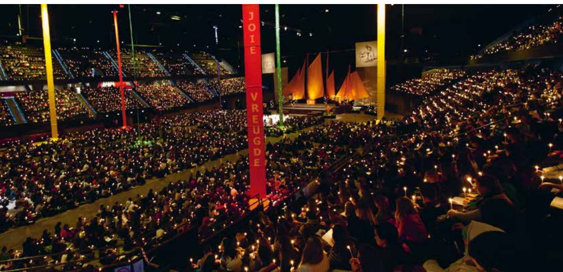
Grafik: Ute Dreiwies, Basel